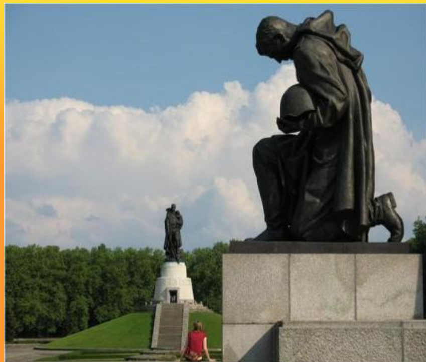
Памятник воинам Советской Армии павшим в боях с фашизмом.