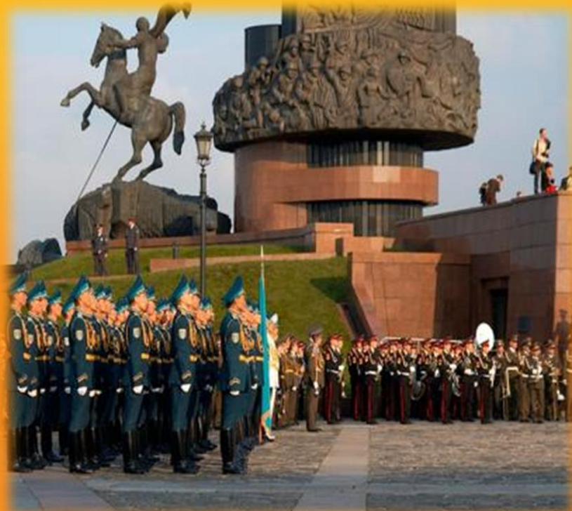
Поклонная гора в Москве