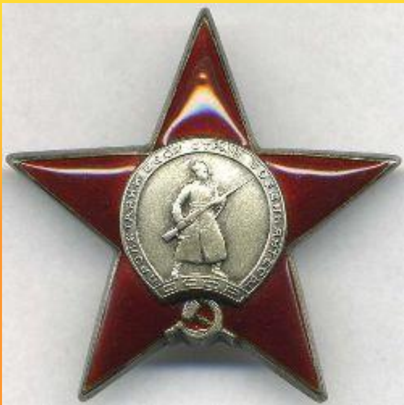
Орден красной звезды