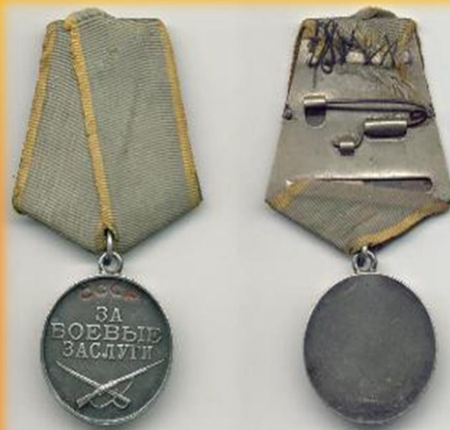
Медаль за боевые заслуги