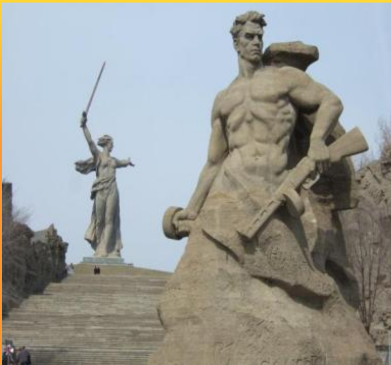
Мамаев Курган в Волгограде Монумент-