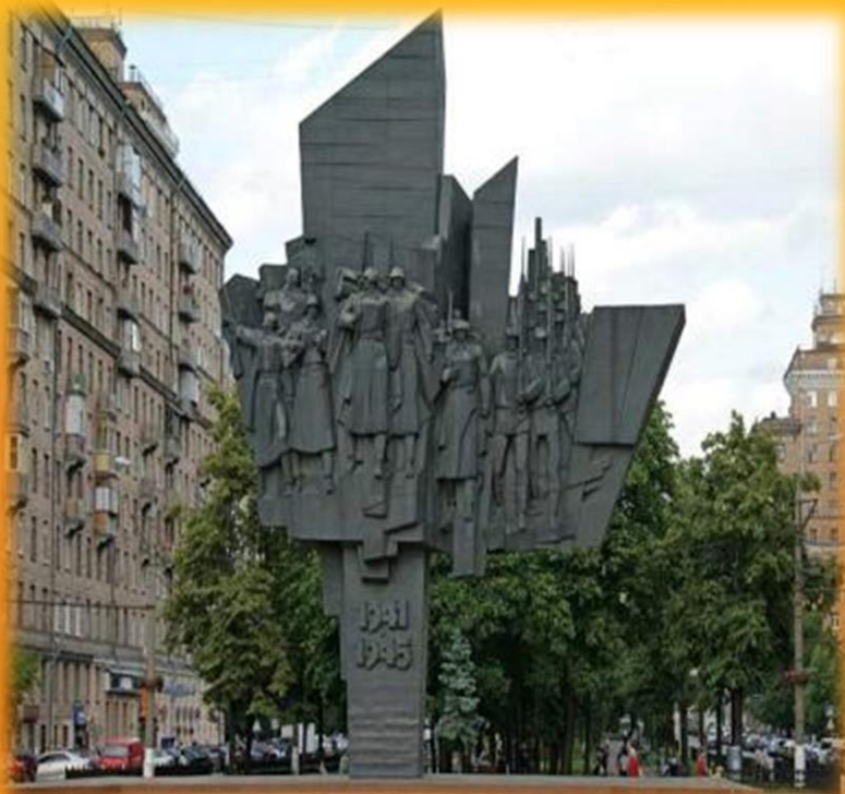
Монумент- «Защитники Москвы»