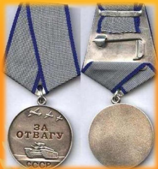
Медаль за отвагу

За героизм и подвиги на войне, солдаты награждались орденами и медалями.